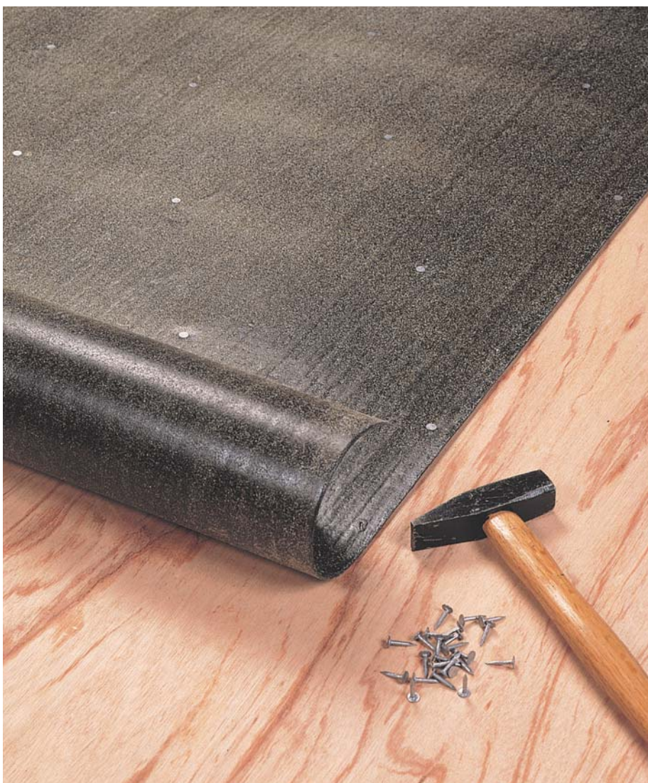
Udlægning af DERBICOAT HP med mekanisk fastgørelse.

Ved anvendelse til andre formål, kontakt venligst vores tekniske afdeling.