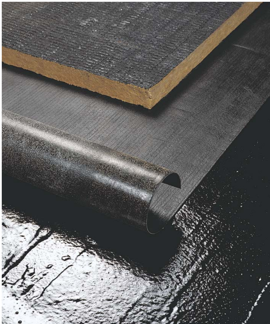
Udlægning af DERBICOAT S med DERBIBOND S.

Ved anvendelse til andre formål, kontakt venligst vores tekniske afdeling.